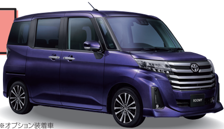
※オプション装着車

ルーミー カスタムG-T 1000cc ガソリン 2WD 5人乗り CVT 車両本体価格 2,257,200円