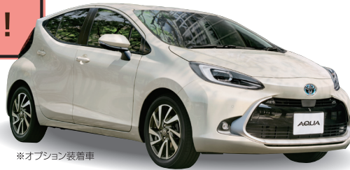
※オプション装着車

アクア Z 1500cc ハイブリッドシステム 2WD 5人乗り 電気式無段変速A/T 車両本体価格 2,565,000円